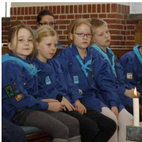
Billeder fra spejdergudstjenesten