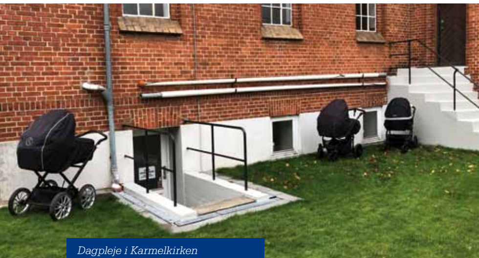
Dagpleje i Karmelkirken