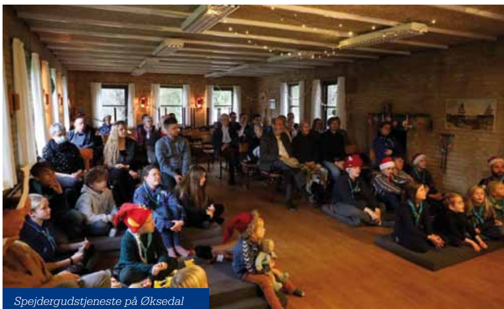
Spejdgudstjeneste på Øksedal

Repræsentanter for Karmelkirken deltager i de forskellige aktiviteter i BaptistKirken, herunder landskonferencesamlingerne. Menigheden betaler sin andel til basisudgifterne, og menigheden vælger årligt tre af BaptistKirken projekter, som hver støttes med kr. 10.000.