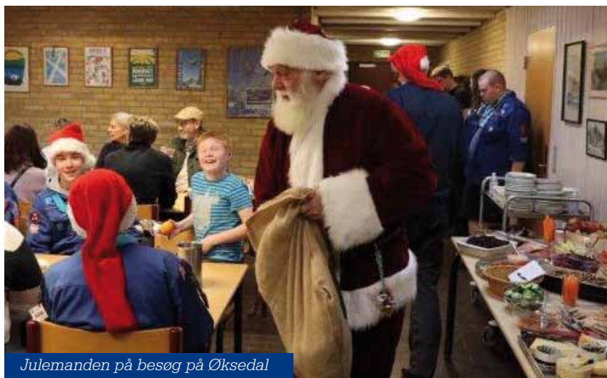
Julemanden på besøg på Øksedal