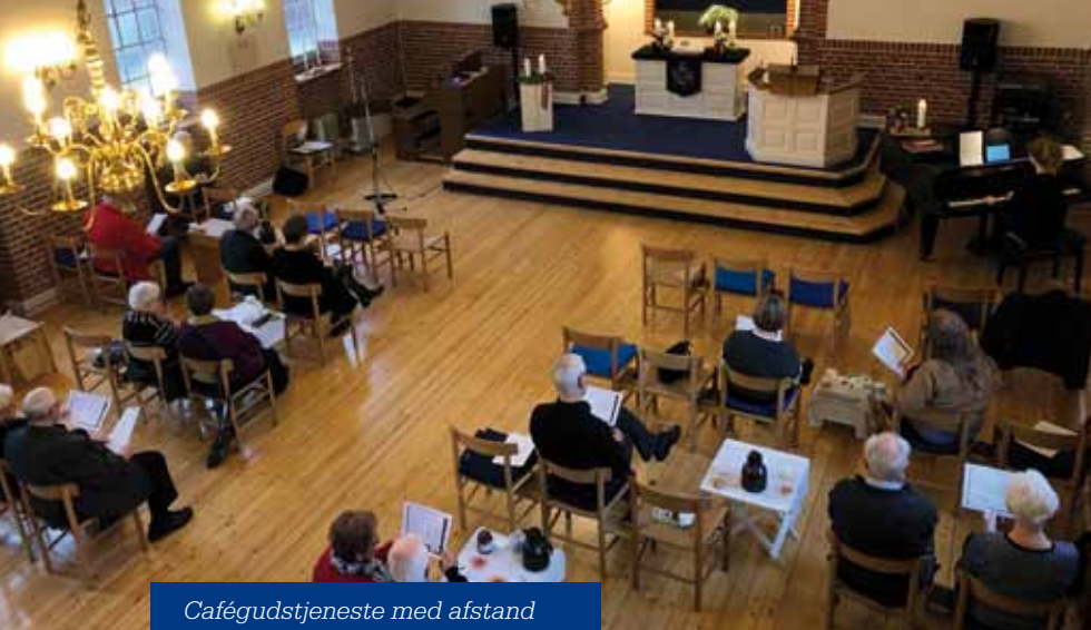
Cafégudstjeneste med afstand