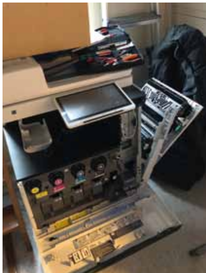
Vi fik ny kopimaskine

orientere sig på den, så man er orienteret om eventuelle ændringer.