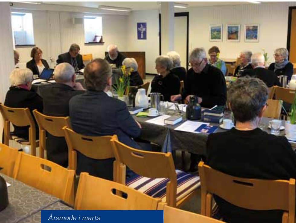
Årsmøde i marts

Nordjysk Kirkedag blev ikke gennemført i 2020.