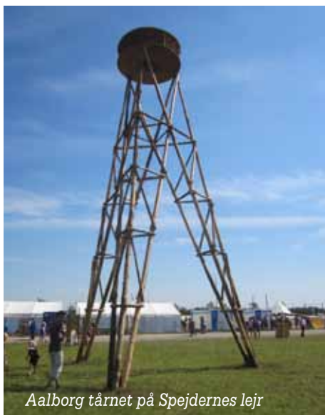
Aalborg tårnet på Spejdernes lejr