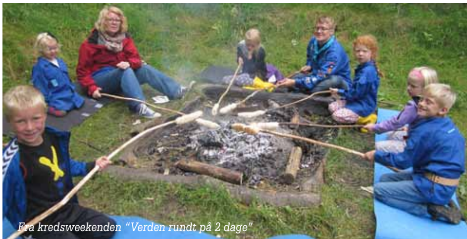
Fra kredsweekenden "Verden rundt på 2 dage"